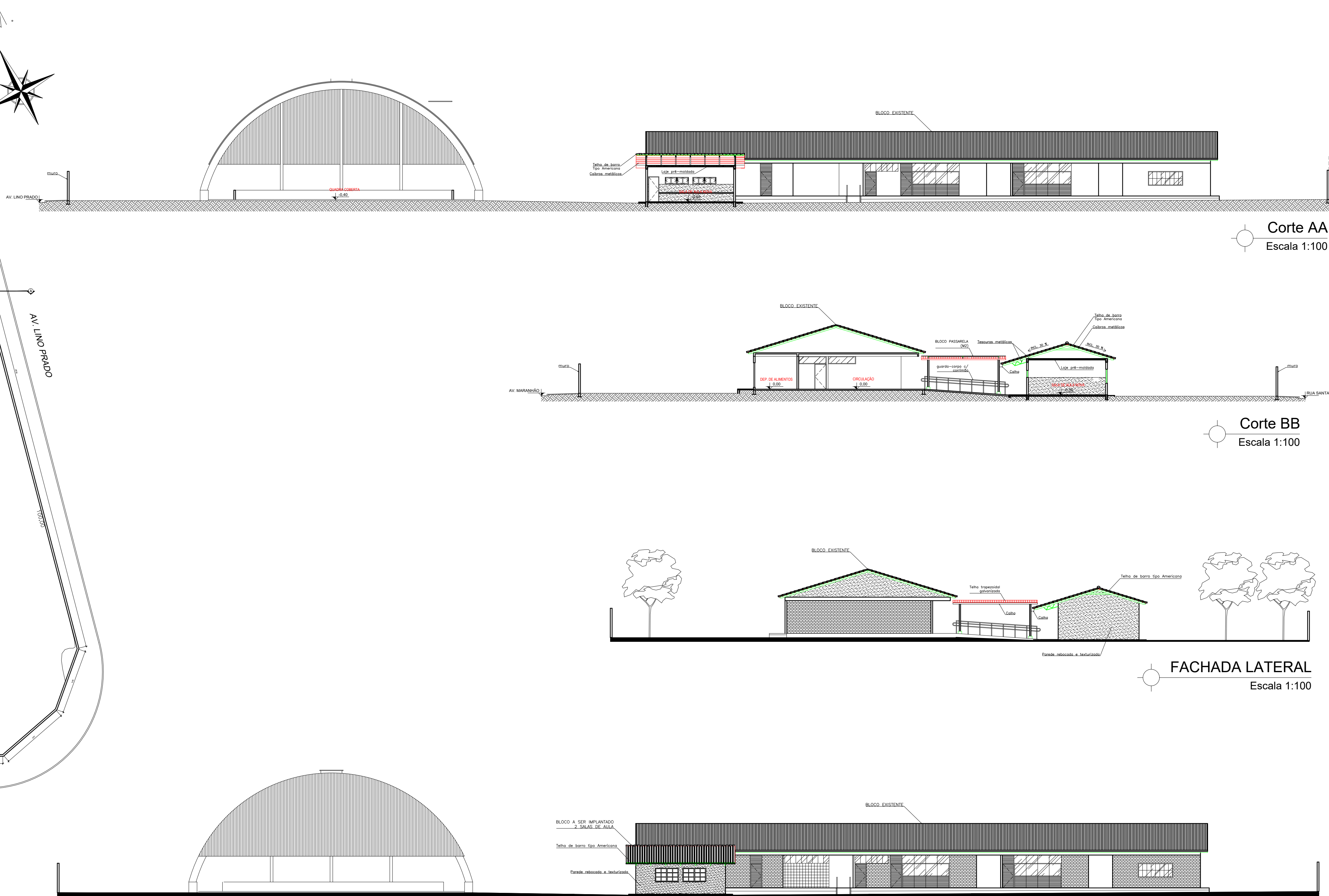
Corte AA Escala 1:100